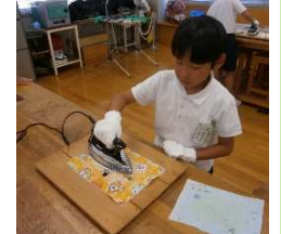
リサイクル工作ということで紙すき体験をしました