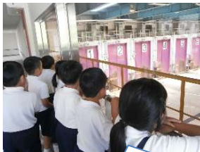
収集車が小さく見えるね

塩江町にあるごみ処理施設、南部クリーンセンターの見学に行きました。4年生は社会科で学習したことを実際に見て、ごみ処理の様子を確かめました。収集車のごみピットにごみを入れるところや、アームがごみをつかんで焼却炉に入れるところ、職員さんが手作業で粗大ごみを分別しているところを見ることができました。正しく分別しないと機械が壊れる原因になったり、職員さんの仕事がより大変になったり、資源として使えるものがごみになってしまったりすることを知りました。家庭でも学んできたことを意識しながら、子どもたち自身が正しくごみの分別ができるようになってほしいです。